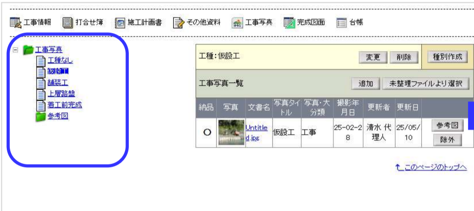
【旧】 工事写真一覧画面(工種・種別・細別ごとのツリー表示)