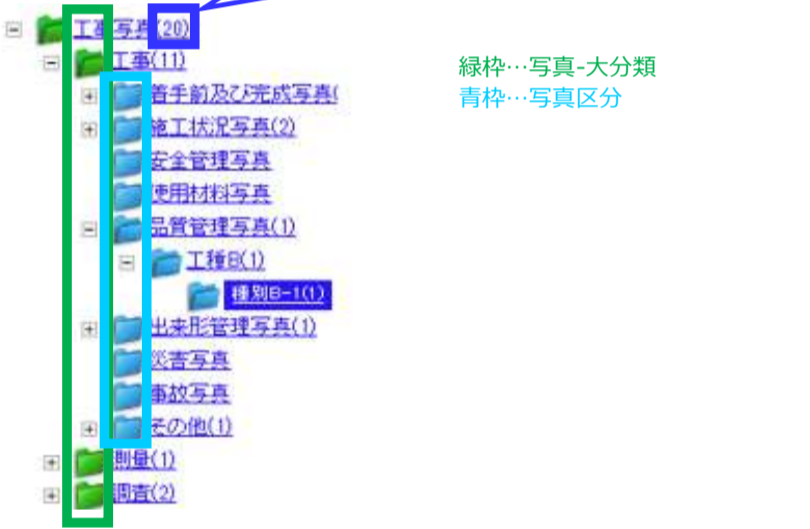
デジタル写真管理情報基準